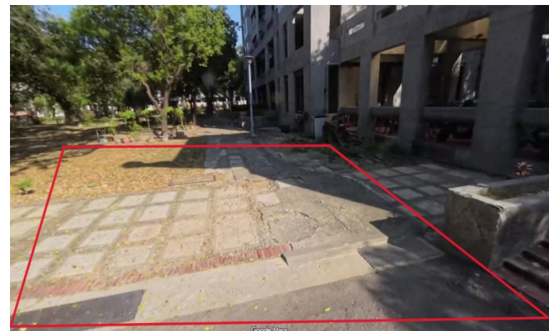
自強校區航太宿舍封路範圍吊車吊裝範圍