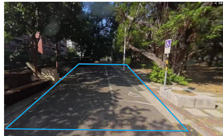
自強校區航太宿舍封路範圍